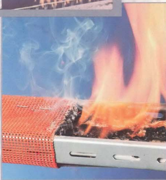
Gewebe verhindert die Brandausbreitung

Die Natur setzt den Menschen Grenzen, doch wir errichten mit unseren Produkten Barrikaden gegen die Naturgewalt „Feuer“.