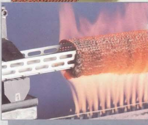
Produktüberwachung und Produktentwicklung auf dem eigenen Prüfstand.